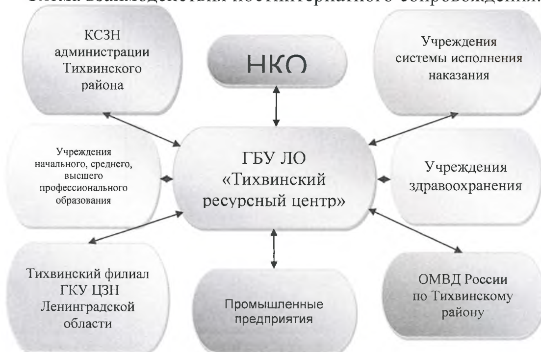
Схема взаимодействия постинтернатного сопровождения.

В учреждении организованы условия для временного бесплатного проживания выпускников до 23 лет в «Социальной квартире».